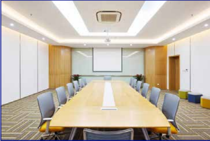
Depuis le mois de mars, salle vide.

Les élections municipales qui se sont déroulées en mars dernier ont permis à certains Conseillers communautaires du Pays de Bray de prolonger leur mandat et de nommer des nouveaux membres de droit.